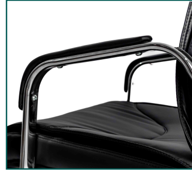
Brazos de aluminio fijos con pad suave