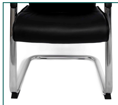
Base metálica cromada de 350mm de radio