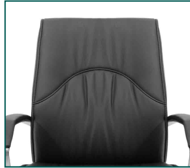
Respaldo hule espuma suave tapizado en vinipiel soft